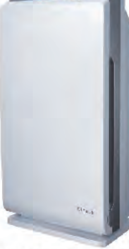
幅320×奥192×高645mm カラー:ホワイト