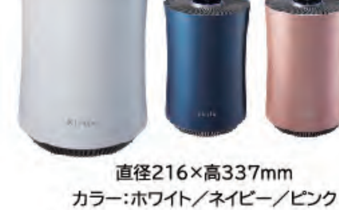
直径216×高337mm カラー:ホワイト/ネイビー/ピンク