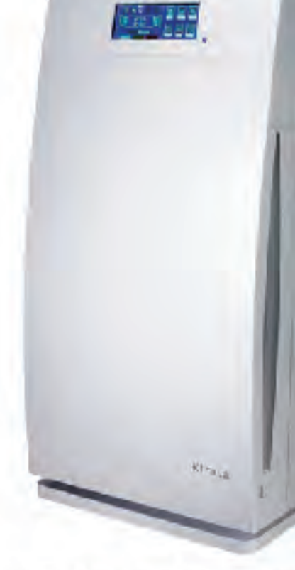
幅320×奥199×高643mm カラー:ホワイト/ブリリアントブルー