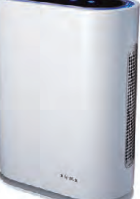
幅350×奥180×高466mm カラー:ホワイト