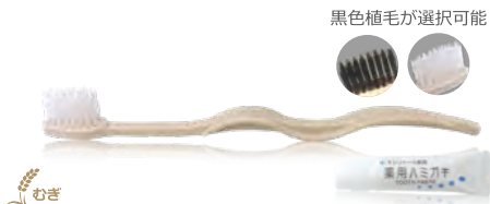
黒色植毛が選択可能